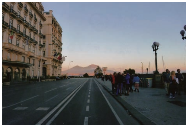
写真②夕焼けに映えるベスビオス火山