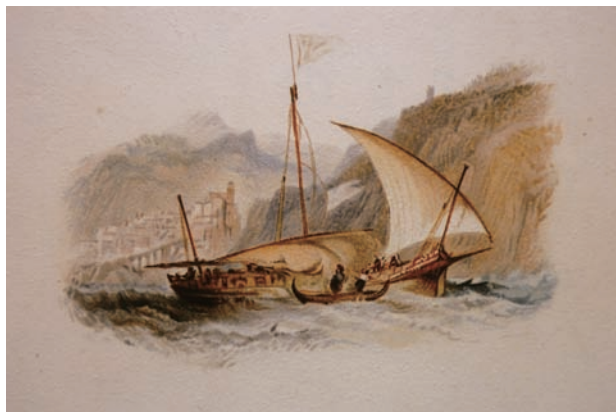
写真① Amalfi J.M.W.Turner