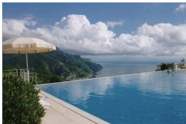
写真⑦ラベッロの天空のプール