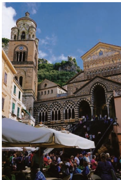
写真⑥ Amalfiの鐘楼と教会、中央奥にサラセン時代の塔