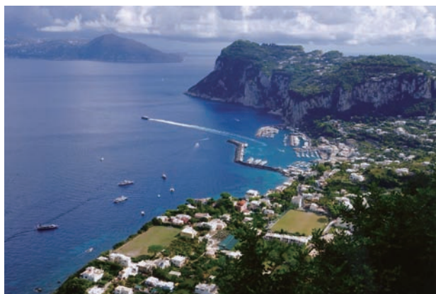
写真③カプリ島、左上はソレント岬